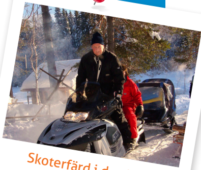
Skoterfärd i det fria